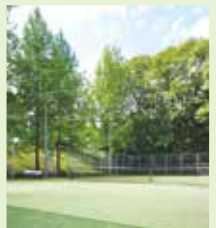
オムコート(2面完備)