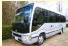
28人乗りのマイクروبス