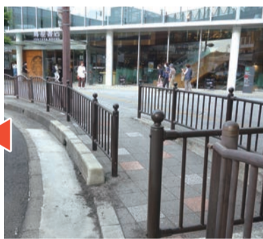
今は使われていないスロープのあるタクシー乗り場