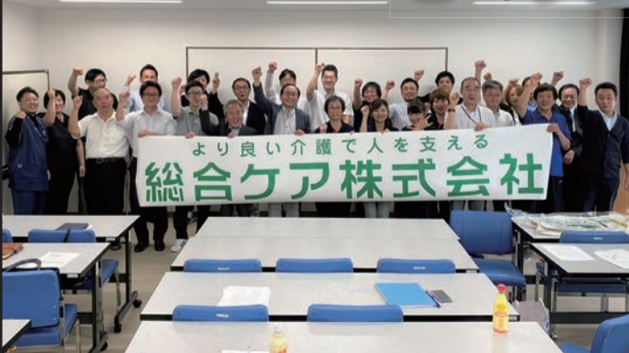
スタッフ一丸となって支えます!