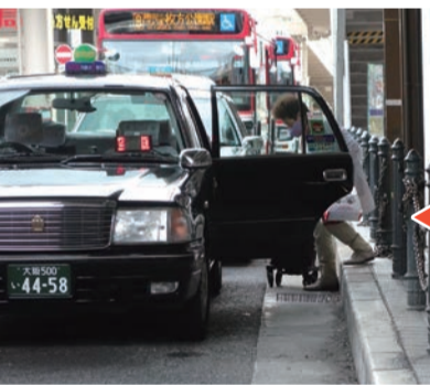
京阪電車枚方市駅前のタクシー乗り場

現在の京阪枚方市駅南口は、1971年の「市街地再開発事業に関する条例」に基づくもので、当時、誘致された百貨店の建物は解体されて、その跡地に2016年、「T-SITE」がオープンした。 駅前ロータリーはバスが回遊し、タクシー乗り場は、京阪電車枚方市駅前に移動した。整備されていたバリアフリースロープのタクシー乗り場は、今や、車いす利用者や高齢者に優しくない段差のタクシー乗り場と化した。