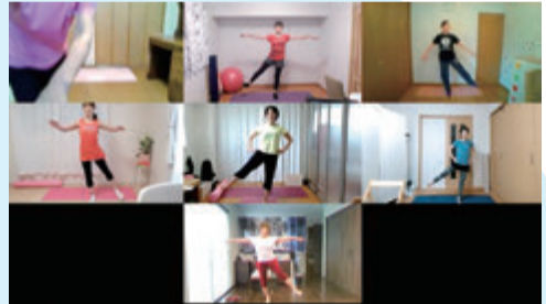
仲間とオンラインの運動は楽しい!