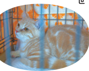
▲出会いを待つニャンコちゃん ◀足が不自由だけど、ここで面倒みてもらって安心だワン!