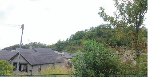
左 岡本山古墳 右 弁天山古墳