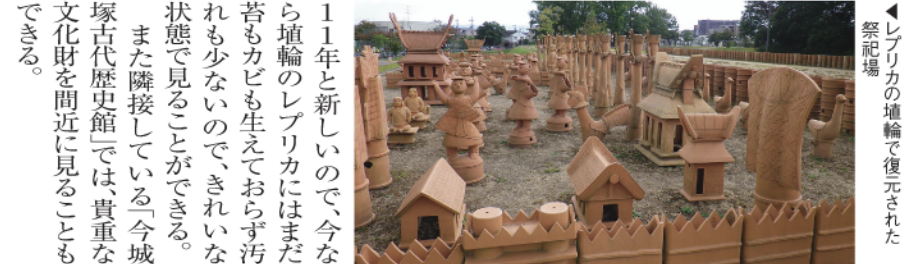
レプリカの墳輪で復元された祭礼場

古墳時代の大王陵の多くが堺・古市に集中していることを考えると、淀川流域に築造されたという点で珍しい存在といえる。