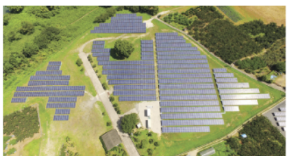
景観や環境に配慮し、メガソーラーの整然とした幾何学的な模様のなかにシンボルツリーとして敷地中央のみもの大木を残しました。