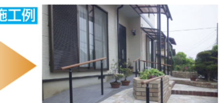
施工例 気になる段差、玄関から車までの動線をスムーズに、利便性を考えた空間の有効利用。玄関横のスペースを活用して、車庫までをスロープ状にして手すりも!

コンパスでは、暮らしの中での「こうしたい!」を既存を活かしたかたちで、家族みんなが使いやすい空間をご提案します