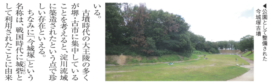
公園として整備された今城塚古墳

古墳時代の大王陵の多くが堺・古市に集中していることを考えると、淀川流域に築造されたという点で珍しい存在といえる。