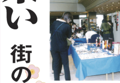
前回の個展市の様子

さんや神農さんの虎を製作している楠田正雄さん、ものづくり企業・淀川製作所のエコ電気自動車など参加申し込みが続き、申し込みが続々と