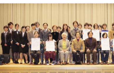
▲「なわてん」授賞式後の記念撮影

7日には、本年度の優秀作品・研究を表彰する「なわてん」が、今年で13回目を迎える。とはいえ、主役はこれから社会に旅立つ学生達のユニークで魅力的な作品論文たち。