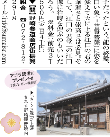
「さくら能」が上演される野崎観音境内

3月27日(日)、ムーブ21(守口市生涯学習情報センター)で、市民サークル個展市と題したフリーマーケットが開催される。ものづくりの町守口をアピール。プロ・アマを問わず、個人・サークルなどに作品発表の場を提供して、展示即売してもらおうというものが、ジャンルを問わず、市内外から自薦、他薦の参加者を募っている。