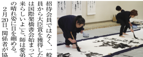
▲祝賀会で師弟揃って揮毫を披露

招待会員ではなく、一般会員から大臣賞を獲得したのは国際架橋書会始まって以来らしいよと、師は愛弟子の晴れ姿に目を細める。 2月20日、関係者が協力して大阪のホテルで開催された受賞祝賀会には115人が出席。「コソコソと一つのことをやり続けてくれたのは、師をはじめに、支えてくださった多くの皆さんや家族のお蔭」と感無量の様子だった。