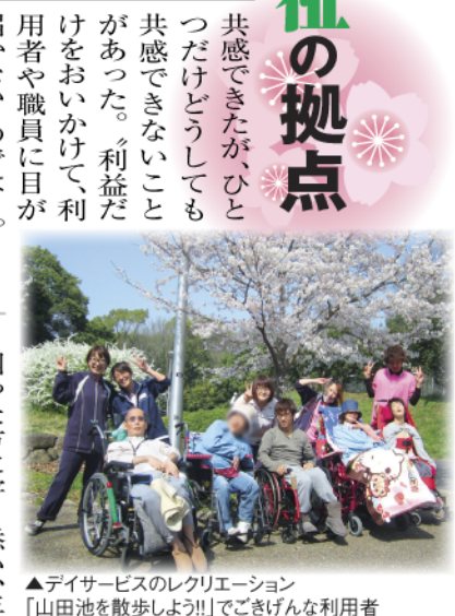
▲デイサービスのレクリエーション「山田池を散歩しよう!」でぎんな利用者

「共感できたが、ひとつだけどうしても共感できないことがあった。利益だけを追い求めて、利用者や職員に目が届かないのでは...」 こうして、利用者や職員を大切にしながら、利益につながる会社を目指した。夢限りなく