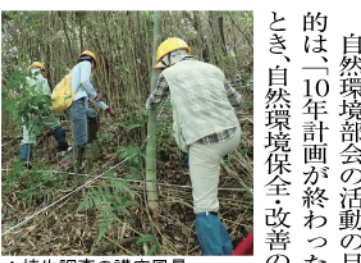
▲植生調査の講座風景

自然環境部会の活動の目的は、10年計画が終わったとき、自然環境保全改善の「一」交野市環境衛生課 072-892-0121