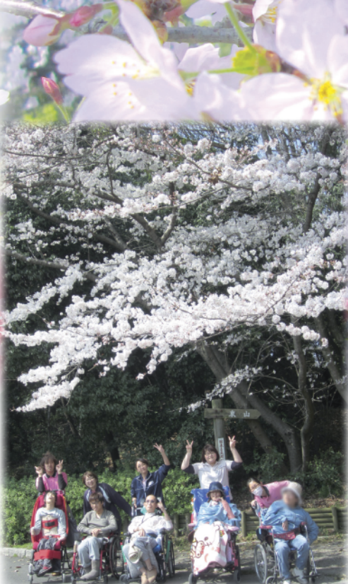
▲昨年4月、桜の下での記念撮影

「桜が春を告げる。」 今ここで、「100年後にだけ残っているだろうか」というユネスコ未来遺産活動が始まる。公園を有する北河内地域は、古墳時代日本に初めて渡来人が馬を運び、国づくりをおこなった場所。「日本最古の馬飼いの里を守る会」(地域住民、学校や団体等)と協力して始まったプロジェクトだ。