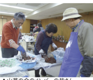
▲山草の会のメンバーの皆さん

3月25日（金）、午前9時から枚方市市民の森（枚方市楠葉丘2-10-1）で新聞紙とセメントを用いた「魔法の鉢作り（主催）枚方市草舎」が行われた。特殊技能や専門知識は全く不要。この日の25名の出席者中、初心者が大勢だったが、それぞれの個性あふれる鉢を完成させた。