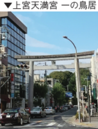
▲上宮天満宮 一の鳥居