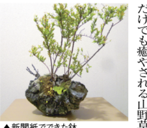
▲新聞紙で作った鉢