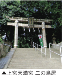
▲上宮天満宮 二の鳥居

「一目見て、他の古墳と決定的に異なるのは、なんと道路の上に古墳がある。というよりも、古墳の下を道路が通っているのだ。」