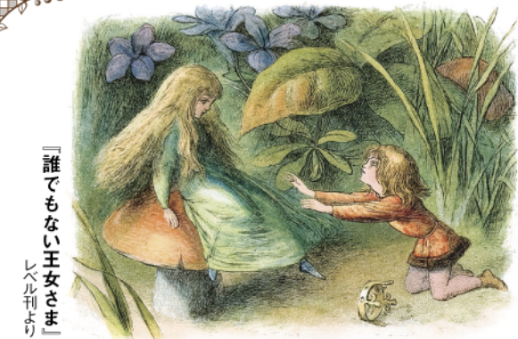
「誰でもない王女さま」 レヘル刊より

シネ・ヌーヴォ www.cinenouveau.com 大阪市西区九条1-20-24 TEL.06-6582-1416 ○地下鉄中央線「九条駅」6号出口徒歩3分 ○阪神なんば線「九条駅」2番出口徒歩2分