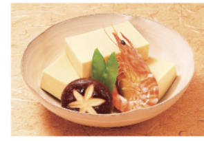
▲定番「含め煮」 ▼「高野豆腐のから揚げ」

スタントタンパクによる胆汁酸の排泄作用だといことがわかってきました。つまりレジスタントタンパクは食べてもそのままの状態に腸に達し、食物繊維のような働きをしながら胆汁酸と結合して体外に排出されるため、体内のコレステロールを減少させる効果が期待できるのです。