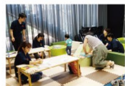
▲講義会場の後部には、同短大幼児保育学科講師と5名の学生の運営協力のもと、「キッズスペース」を設営、子連れのお母さんも安心

「毒はおいしい」という、ショッキングなテーマながら、普段見過ごしがちな食品添加物についてユーモアを交えながらの考察は意義深いものだった。