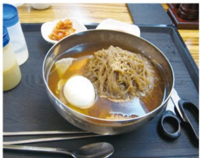
水キムチの冷麺を水冷麺と呼ぶ

ぜい100年前、或いは朝鮮戦争で南北の避難民が交錯した1950年代とも言われている。それが南部温暖地方へ広がるにつれて外食メニューになって夏の嗜好品に変わっていった。実は冷麺はかつて北部地方の大都会・平壤の花柳界で好まれた程の洒落た料理でもある。その淡白な食味を風流人たちが愛でたという話もある。