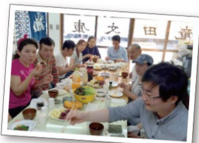
▲手巻きずし、おいし〜!