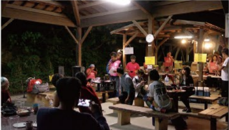
▲日本人最高位のトレイルランナー・土井慶選手と井上真悟選手のトークライブも開催されたキャンプ地で仲間と寝食を共にすることで深い人間関係が生まれる。翌日は前日の疲労が抜けないままに7時にウォーク、1つ1つチェックポイントを進んで感動のゴール。一泊二日の大冒険へのエントリーは終了する