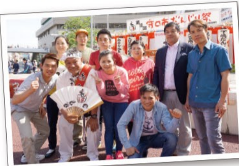
▶西端守口市長(右から2番目)と日本語教室「ほっと守口」の生徒たち