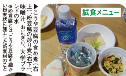
▲講義後の参加者たち。和気あいの試食会

「食事は質は心の健康に影響がある」など、唆に富む言葉と、和食給食を行う保育園の事例などを紹介。「ぬき」(ぬか・きなこ・ごまのふりかけ)の作り方なども披露し、日本の伝統食材の効用を説いた。