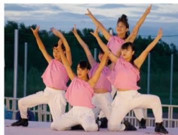
「オープニングを飾ったダンスのパフォーマンス」

市の予算5,000万円に加えて、協賛優待席を7,500席用意して、 団体、企業、市民に一口5,000円の協賛を募った。こうして官民協働の夢が実現した。