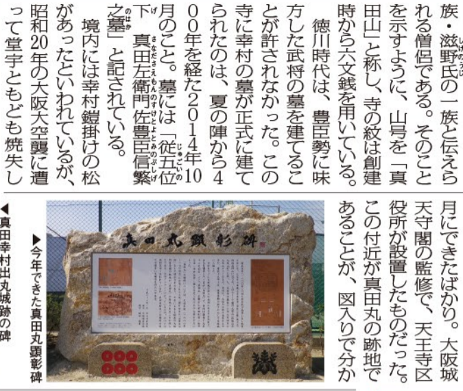
▲今年できた真田丸顕彰碑 ▲真田幸村出丸城跡の碑

現在山門の前には「真田幸村出丸城跡」の碑がある。また道路を挟んだ向かい側には、真田丸の跡地とされる明星高校があり、道路の脇には「真田丸顕彰碑」がある。これがやけに真新しくきれいだと思う「それとも、今年1月にできたばかり。大坂城天守閣の監修で、天王寺区役所が設置したものだ。この付近が真田丸の跡地であることが、図入りでわかりやすく説明されている。三光神社と心眼寺の周りには、坂道が多い。この高低差がまさしく真田丸の周囲に掘られていたといわれる空堀も、相当な深さがあったと想像できる。徳川の軍勢をおびき寄せ、上から鉄砲を浴びせれば、ほぼ一方的に優勢な防御戦闘を展開できたはず。事実、幸村は戦いをそのように展開したのである。余談ながら、心眼寺には幕末の動乱期に因縁のある人物の墓もある。慶応3年(1867)11月15日、坂本龍馬と中岡慎太郎が暗殺された「近江屋事件」に関与したとされる京都見廻組の渡辺吉太郎と桂早之助が、この心眼寺に葬られているのだ。