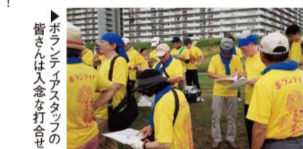
▶ボランティアスタッフの皆さんは入念な打ち合わせ