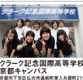
クラーク記念国際高等学校 京都キャンパス 京都市下京区仏光寺通新町東入系屋町219 ☎075-3553-6955

なかでも京都キャンパスでは高校と専門学校と大学が連携して、1～3年生の間に専門学校でキャリア教育(ペット系、スポーツ・医療系、コミックイラスト系等)を年2回、大学では(外国語系分野、心理学系分野、芸術学系分野等)を年6回、それぞれの学びを通して25歳の大人になった自分をイメージし、「人生」を考えるという「マイ