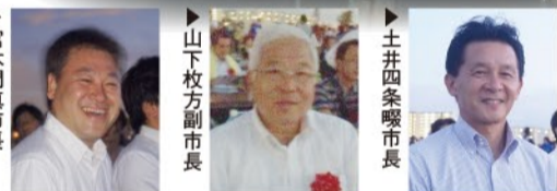
▶開会の挨拶をする西端守口市市長 ▶宮本門真市長 ▶山下枚方副市長 ▶土井四条曜市長