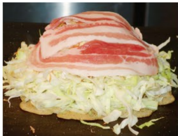
▲見よ! このキャベツの存在感