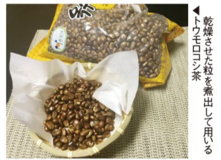
乾燥させた粒を煮出して用いるトウモロコシ茶

これは麦茶の麦を乾燥トウモロコシに代えたものと思えばよい。最近では日本の韓国食堂でも供されるため日本人にも愛飲者が多い。 いずれも穀類の焦げる香はしさを生かした飲料で、茶やコーヒーのようなカフェインは含まれない。これら穀物素材の飲料を穀茶と呼ぶ。 一方、朝鮮王朝宮中では王の滋養長寿を願い、漢方薬材を煎じた飲料を作った。宮中では国内はもちろ外国から入った高級な薬材をふんだんに使った。その代表が、高麗人蔘をゆっくりに煎じてエキスを抽出した人蔘茶だ。薬、枸杞、桂皮(シナモン)なども多く使われた。これも茶とされた。 これらは民間にも伝わるが庶民たちは高価な薬材の代わりに、ユルム(ハト麦)、生姜、柚子など身近にある食材で工夫した。これらはいずれも現代にまで伝承され、韓国土産品としても定着した。