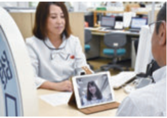
▲窓口職員と手話通訳者と手話が必要とする人が3方向で会話

設置窓口：市民課および保険事業室(市役所本庁)、ねやがわシティ・ステーション(駅前出張所)、障害福祉課(総合センター) 設置台数：各1台(合計4台) (問)072-824-1181 市民生活部 市民課(代表)