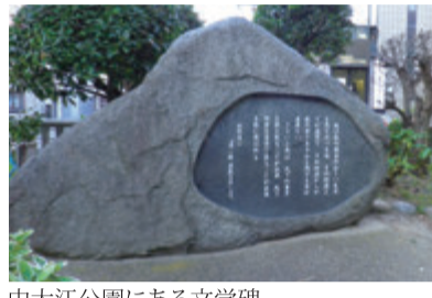
中大江公園にある文学碑

その後も浩二は精力的に作品を発表し続け、中には「清二郎 夢見る子」「十軒路地」「大阪」など大阪の人情や風俗を描いた作品もある。その独特の文体は「饒舌体」と呼ばれた。