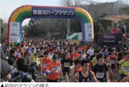
▲前回のマラソンの様子

寝屋川ハーフマラソン実行委員会は、平成30年2月25日に開催する「寝屋川ハーフマラソン2018」の参加ランナーを募集している。 「あなたはこの坂に耐えられるか」をキャッチフレーズに、最大高低差45メートル、コースの約3分の2が坂道という難コースを踏破。毎回5000人がエントリーする名物マラソン。寝屋川公園をスタート・ゴールに、打上川治水緑地や丘陵地、菅島近辺を中心とした市内各所を巡る。