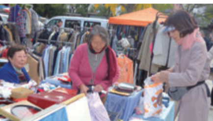
フリーマーケットで支援活動費を捻出

のアイヌ文化との出会いを契機に異文化に興味を持つようになった。57歳の時、中国語教室の講師の帰省に