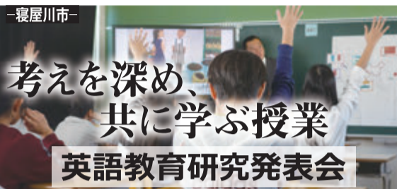
考えを深め、共に学ぶ授業 英語教育研究発表会

「見る！触れる！学ぶ！」通信大学主催の「テクノフェア in ねがわがわ」が、同大学寝屋川キャンパスで開催された。今年で10回目を迎えた秋の恒例イベントは、日常生活において触れる機会が少なく、難しいイメージを抱きがちな科学技術をおもしろく紹介。深刻視される理科離れへの対応策として近隣の教育委員会後援のもとで始まった。