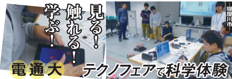
電通大 テクノフェアで科学体験