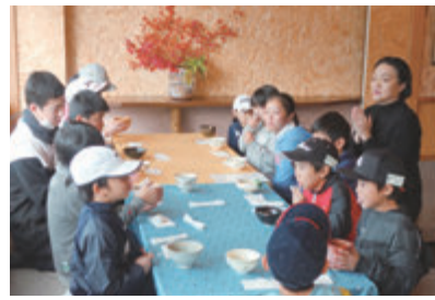
お抹茶を頂き、礼節を学ぶ

枚方市 心技一体で子どもたちを育成 ゴルフスクールでお抹茶体験 尊延寺の和幸カントリー倶楽部では、幼稚園児から高校生まで100人のジュニアの育成に取り組んでいる。同スクールは、入会時には面接を行うなど、ゴルフを通して子どもたちの健全な成長を目指している。初心者から上級者ま