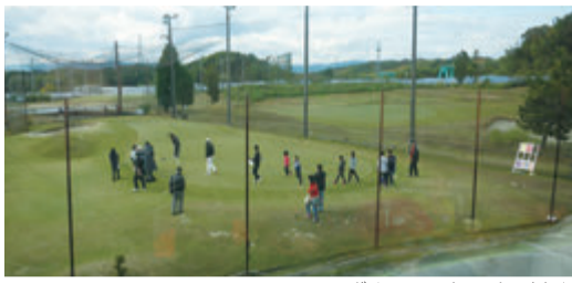
グリーンでストラックアウト

心技一体で子どもたちを育成、ゴルフ技術の習得、指導だけでなく、世代間交流の豊かな環境の中、挨拶の励行など基本的な社会性を身につけた子どもたちの育成に努めているという。