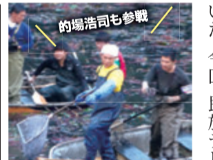
市民・学生たちが大奮闘 アリゲーター捕獲成功

市立サダ小学校の土曜参観の日、アンダーグラフのリーダーで、枚方PR大使でもある真戸原直人さんが母校を訪問。5・6年生全員と保護者の歓迎を受けた。真戸原さんは「サダ小は大好きな学校。ここに来て涙が出るほどの感激です」とあいさつ。児童たちは真戸原さんのギターと歌に合わせて、自作曲と歌に合わせて、自作曲と歌が校内に響き渡った。