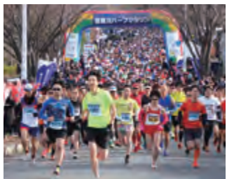
昨年のハーフマラソン

毎年5000人を超えるランナーが参加する。来年2月23日(日)に開催される「寝屋川ハーフマラソン2020」に合わせ、参加者を募集している。「JR寝屋川公園駅」そばの寝屋川公園をスタート。丘陵地、成田山不動尊、第二京阪道路副道、萱島近辺を中心とした市内各所を巡る最大高低差45メートル、コースの約3分の2が坂