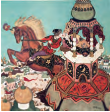
「エドモンド・デュラックのフェアリーブック」1916年版より

ロシアの民話に出てくる主人公でイワンという男がいる。純粋なゆえに人から馬鹿にされるが、その実直な性格から最後は幸運をつかむストーリーが多い。