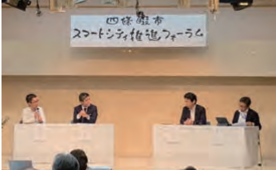
スマートシティ推進に向けて議論

地域課題をAI・シミュレーション等の技術を活用し、課題解消をする「歩行姿勢測定システム」についてのフォーラムが四條畷市の「笑顔診断」、「似てる度診断」、奈良先端科学技術大学院大学の「観光動画像付きガイダンスシステム」、関西電力の「無線充電システム」、小型ドローン技術、未来に向けたスマートシティ技術についてパネルディスカッションが行われた。参加者の理解も深まった中、林副市長の閉会の挨拶で終了した。