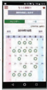
市公式アプリ「もっと寝屋川」

市公式アプリの「もっと寝屋川」は、防災・防犯・子育て・教育・イベントやお知らせ、緊急災害情報、不審者情報、法律相談予約機能、母子手帳機能など多岐にわたった行政情報がインポートされている。この「総合型アプリ」は、大阪府内初の取り組みで、市民が自分の知りたい情報をピンポイントで入手できる。この8月からさらに、市の集団検診(16種類)予約ができるように健康部健康づくり推進課で窓口、郵送、電子申請システムで受け付けていた検診予約がアプリ