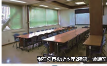
現在の市役所本庁2階第一会議室

10月から、すべての市の常勤職員(正規職員、再任用職員など175人)に、1か月の総勤務時間の範囲内で働く時間の長さを自分で決めることのできる「完全フレックスタイム制」を導入する。また、総勤務時間を超えて働くことを希望する職員のために「希望残業制度」を導入。職員自ら収入の増減をコントロールできる環境を整備する。多様な働き方に対応するために、市役所本庁舎2階第一会議室をカフェスペースとして開放する。