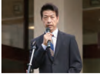
初登壇であいさつする伏見市長

9月1日の枚方市長選挙で、再選を果たした伏見隆新市長が4日に初登壇した。この4年間は、市民の皆さんの生活を守るとともに、改革により財源を生み出して枚方の魅力を創り出し、持続可能な発展を目指すことに全力を注いでまいりました。2期目も掲げた公約を実現し、踏み込んだ改革をしっかりと行い成長のサイクルをつくって、枚方市をさらに住みよいまちへ、選ばれたまちとなるよう、全力を注いでまいります。職員の方々とともに、市民や職員約200人が出迎えるなか、決意を述べた。