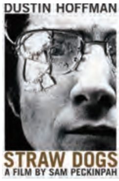
DUSTIN HOFFMAN STRAW DOGS A FILM BY SAM PECKINPAH

(1971年 監督：サム・ペキンパー) 出演：ダスティン・ Hoffman、スーザン・ジョージ、デビッド・ワーナー 他