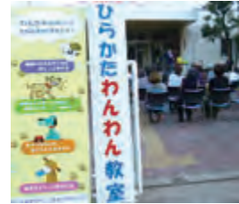
わんわんしつけ教室

犬を飼っている人やこれから犬を飼いたい人のための「犬のしつけ方教室」が開催される。①10月19日(土)、午後2時～4時30分、保健所、②20日(日)、午前10時～午後2時30分、穂谷川清掃工場で各回開催される。 また、市立小学校の4年生から6年生を対象に、ペットの幸せや健康を考慮して飼育するための心構えを記載したパンフレット「ほんとうに飼えるかな?」など学術講座(中・大型犬クラス、小型犬クラス)先着各5組、①も受講できる人のみも受け付ける。②とも無料。申し込みは072-8077-624(問)か、担当者は話す。