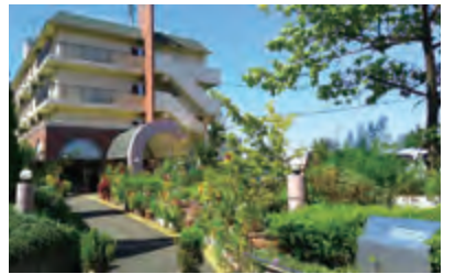
介護付有料老人ホームほぶら

さわやかな秋風に肌をなでられ、ふかふかした田んぼの土の感触に、癒やされてみませんか?