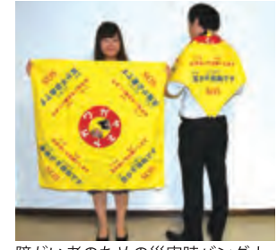
障がい者のための災害時バンドナ

寝屋川市は、障害がある方が災害時に着用して周囲の人に障害を知らせることができる「障害者災害時支援バンドナ」を無料で配布している。視覚や聴覚が不自由な方には「目が不自由です」「耳が不自由です」と書かれ、精神疾患の方には「支援が必要ですよ」のメッセージ入りで、90センチ四方のバンドナで目立つ黄色。今後、小中学校等の一次避難所にも難所にも備蓄を予定。受け取り場所は、障害福祉課保健福祉センター、市立東障害福祉センターの2か所。(※両窓口は9時～17時30分まで) ※障害者手帳の持参が必要(難病患者は医師の意見書等疾患名が確認できるもの) (問)07283880382 市福祉部障害福祉課