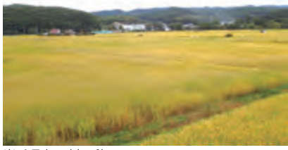
岩手県九戸村の秋