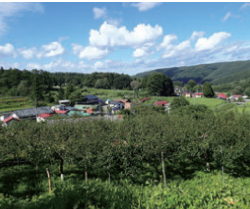
イワテヤマナシ見本園