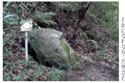
石垣になれなかった残念石